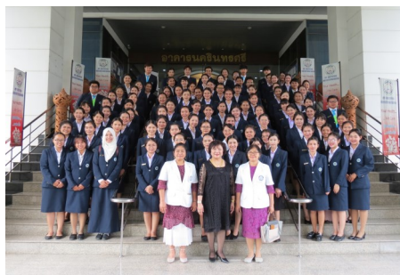
นักศึกษาพยาบาล วิทยาลัยนานาชาติเซนต์เทเรซา (23 สิงหาคม 2562)