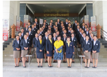
นักเรียนผู้ช่วยพยาบาล วพบ.ตำรวจ (22 กรกฎาคม 2562)