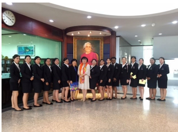
นักศึกษาพยาบาล (2 ภาษา) ม. รังสิต (9 กรกฎาคม 2562)

คณะอาจารย์ นักศึกษาคณะพยาบาลศาสตร์ และนักเรียนผู้ช่วยพยาบาล จากสถาบันการศึกษาต่างๆ เข้าศึกษาดูงานและเยี่ยมชมพิพิธภัณฑ์และหอจดหมายเหตุ สภากาพยาบาล