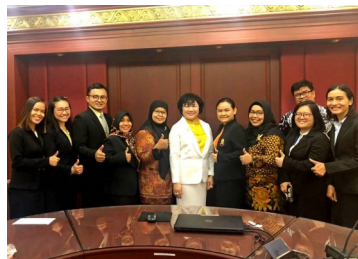
นักศึกษาพยาบาล ม.ขอนแก่น (18 กรกฎาคม 2562)