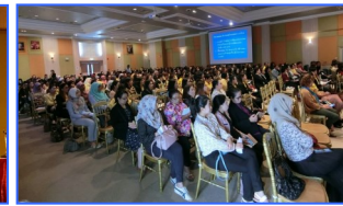
ครั้งที่ 3 วันเสาร์ที่ 20 และวันอาทิตย์ที่ 22 กรกฎาคม 2562 ณ โรงพยาบาลหาดใหญ่ และโรงพยาบาลเบตง จังหวัดสงขลา