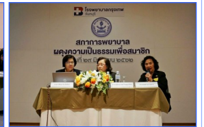
ครั้งที่ 2 วันเสาร์ที่ 29 มิถุนายน 2562 ณ โรงพยาบาลกรุงเทพจันทบุรี จังหวัดจันทบุรี