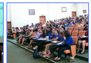
ครั้งที่ 4 วันเสาร์ที่ 17 สิงหาคม 2562 ณ ห้องประชุมมิตรภาพ โรงพยาบาลศรีนครินทร์ มหาวิทยาลัยขอนแก่น จังหวัดขอนแก่น

สำหรับการประชุมวิชาการเรื่อง “จริยธรรมวิชาชีพกับการถูกร้องเรียน การปกป้องและผดุงความเป็นธรรมแก่ผู้ประกอบการวิชาชีพการพยาบาล” มีกำหนดจัดทั้งสิ้น 5 ครั้งในปี พ.ศ. 2562 นี้ โดยสภาการพยาบาลได้จัดการประชุมในจังหวัดต่างๆ แล้ว ดังนี้