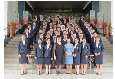
นักศึกษาพยาบาล วพบ.นพรัตน์วชิระ (23 สิงหาคม 2562)